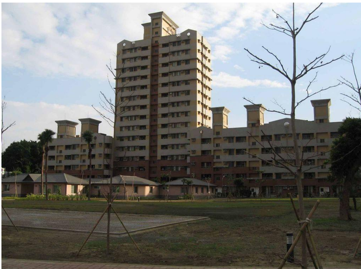
實踐大學高雄校區「高雄衛理學生中心」